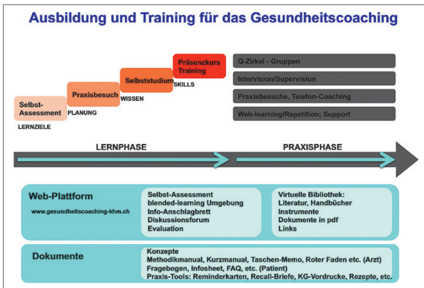
Abbildung 4 Fortbildung, Training und Support im Projekt Gesundheitscoaching.

Dieser Artikel ist der erste einer Serie zur Thematik «Gesundheitsförderung und Prävention in der Arztpraxis».